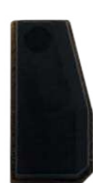
T5 VIRGEM (ID20)